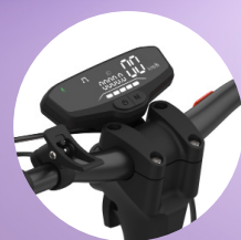
Display LCD Multifunzione