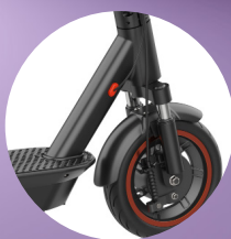
Ammortizzatore anteriore e posteriore